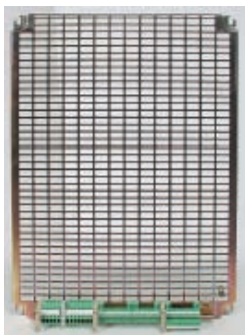
Boîtier de commande Gestion de la partie opérative Moteur de la partie opérative Borniers d'alimentation

- une platine vierge à câbler avec borniers débrochables. En option, sont disponibles des platines supplémentaires.