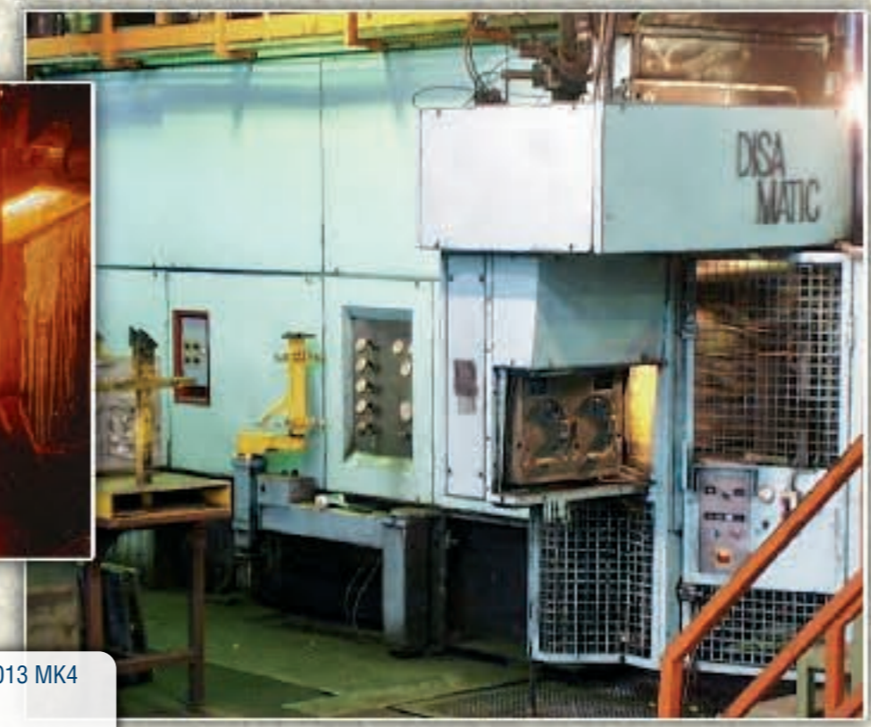
Vertikaler Guss auf Disamatic 2013 MK4 Kapazität: 4000 Tonnen / Jahr Abschlagkasten von 480 x 600 330 Abschlagkasten / Stunde