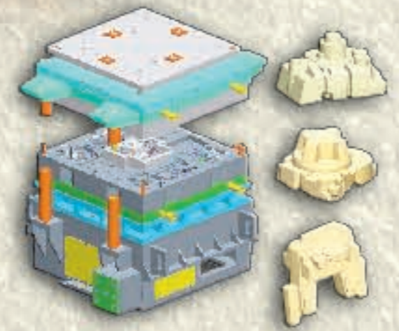
Formkasten mit Kern von 40 Litern