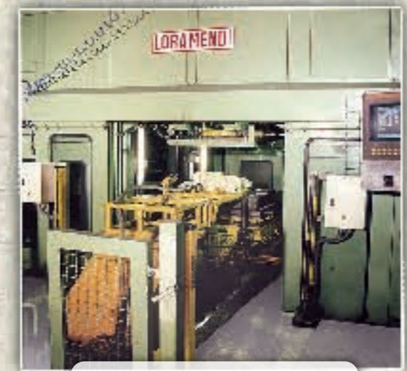
Kernformungsstation mit 40 Litern