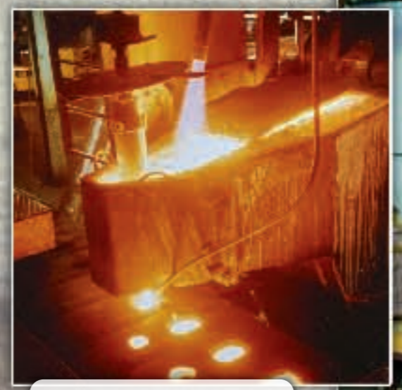
Gießofen der Disamatic