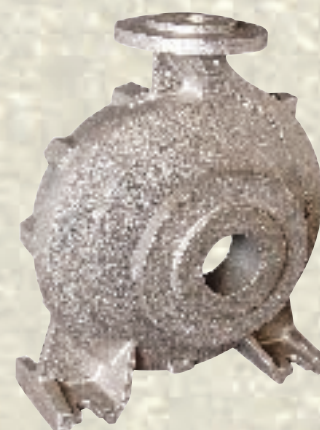
Pumpengehäuse / 33 kg