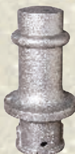
Markierungspfosten / 11 kg