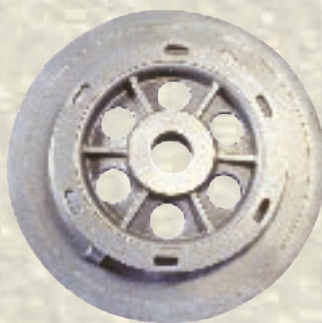
Riemenscheibe / 15 kg