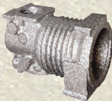
Kompressorengehäuse / 20 kg