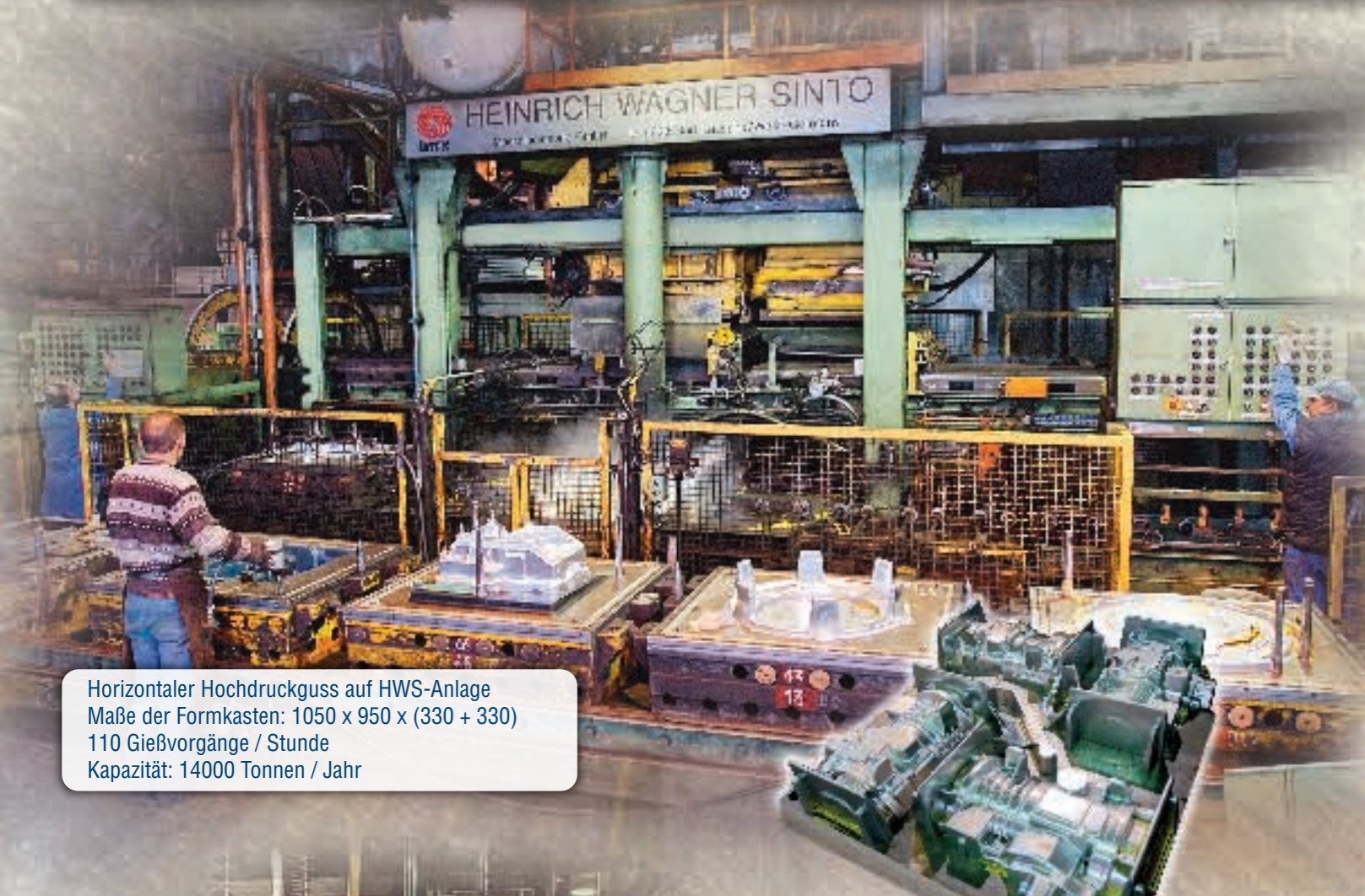
Horizontaler Hochdruckguss auf HWS-Anlage Maße der Formkasten: 1050 x 950 x (330 + 330) 110 Gießvorgänge / Stunde Kapazität: 14000 Tonnen / Jahr

ZUVERLÄSSIGER UND LEISTUNGSSTARKER HERSTELLUNGSPROZESS