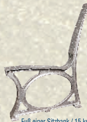
Fuß einer Sitzbank / 15 kg