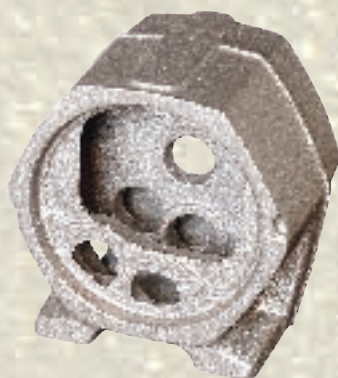
Getriebegehäuse / 9 kg