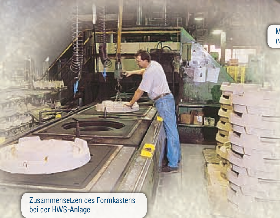
Zusammensetzen des Formkastens bei der HWS-Anlage