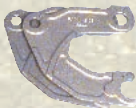
Teil für Webstuhl