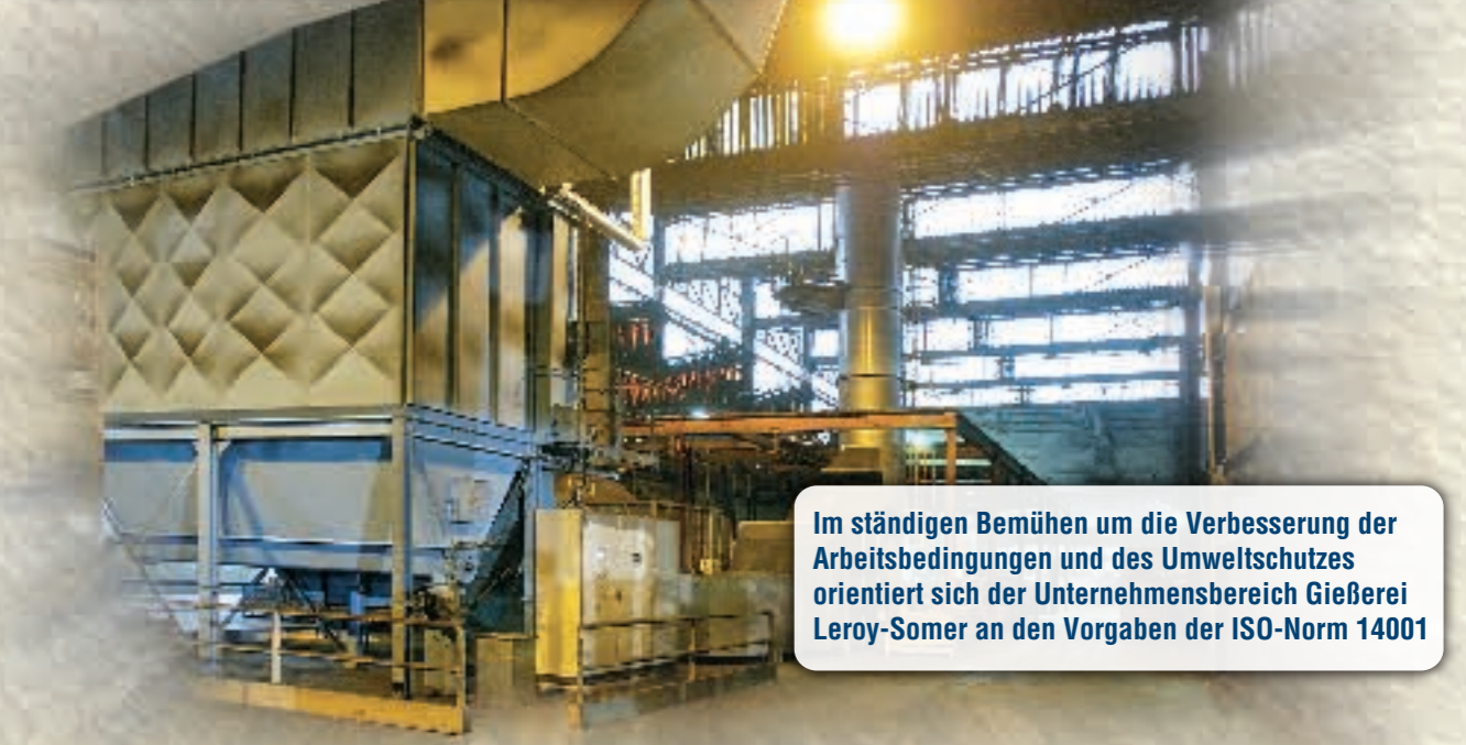
Im ständigen Bemühen um die Verbesserung der Arbeitsbedingungen und des Umweltschutzes orientiert sich der Unternehmensbereich Gießerei Leroy-Somer an den Vorgaben der ISO-Norm 14001