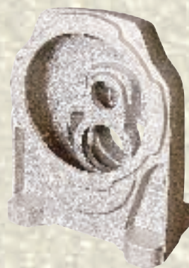
Getriebegehäuse / 20 kg