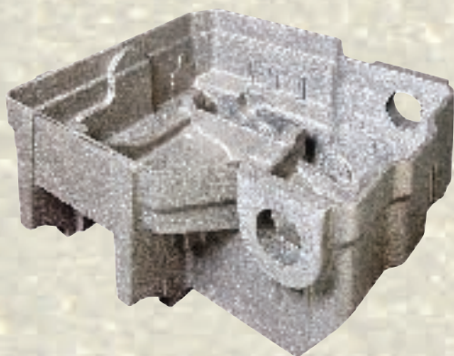
Webstuhlrahmen / 98 kg