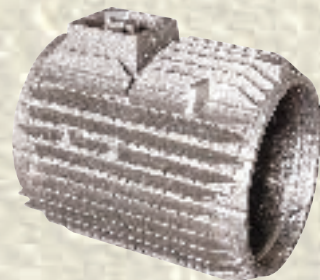
Elektromotorengehäuse / 21 kg