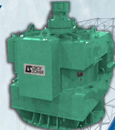
Alternateurs basse et moyenne tension