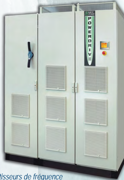
Convertisseurs de fréquence