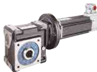
Servoréducteur pour application nécessitant une grande compacité et une dynamique élevée