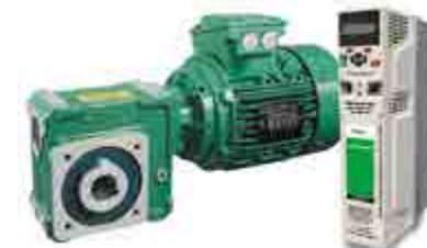
Système d'entraînement avec moteur à vitesse variable LSMV et pilotage centralisé avec variateur