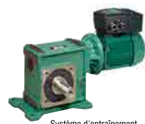
Système d'entraînement avec variateur de vitesse intégré ID300