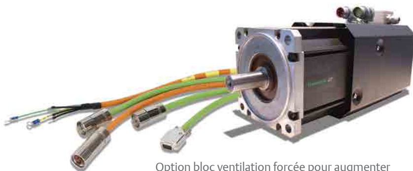
Option bloc ventilation forcée pour augmenter les performances thermiques