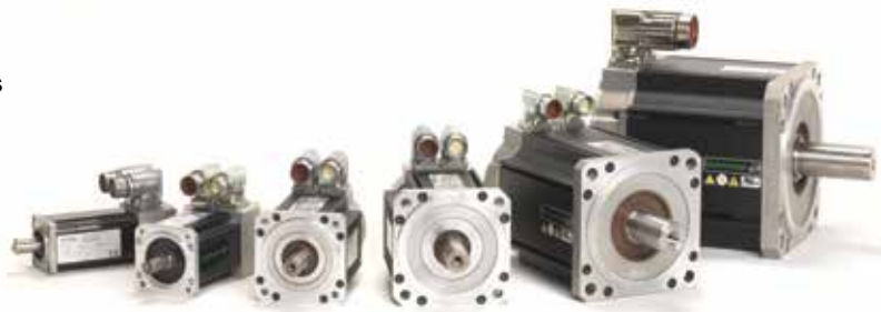
La famille Unimotor hd se caractérise par une gamme de 55 à 190 mm de carré.

Unimotor hd offre un rapport puissance/poids élevé, ce qui signifie qu'il peut être facilement intégré dans les applications exigeant une grande compacité : robotique, emballage, pick and place.