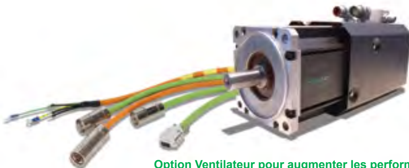
Option Ventilateur pour augmenter les performances thermiques