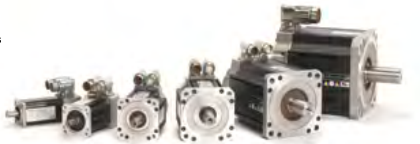
La famille Unimotor hd se caractérise par une gamme de 55 à 190 mm de carré.

Unimotor hd offre un rapport puissance/poids élevé, ce qui signifie qu'il peut être facilement intégré dans les applications exigeant une grande compacité : robotique, emballage, pick and place.