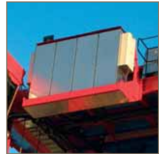
Powerdrive Inverter in roestvrijstalen behuizing

Italiaanse expertise op het gebied van mechanisch design en vernieuwing met de modernste technologie om een kwaliteitsproduct met uitstekende betrouwbaarheid te creëren.