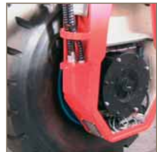
In die Radnabe integrierter HPM-Motor