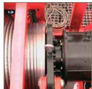
In die Windentrommel integrierter HPM-Motor