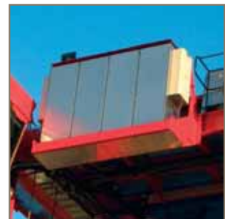
Frequenzumrichter Powerdrive in Edelstahlgehäuse

modernster Technologie, um so ein qualitativ hochwertiges Produkt von außergewöhnlicher Zuverlässigkeit zu schaffen.