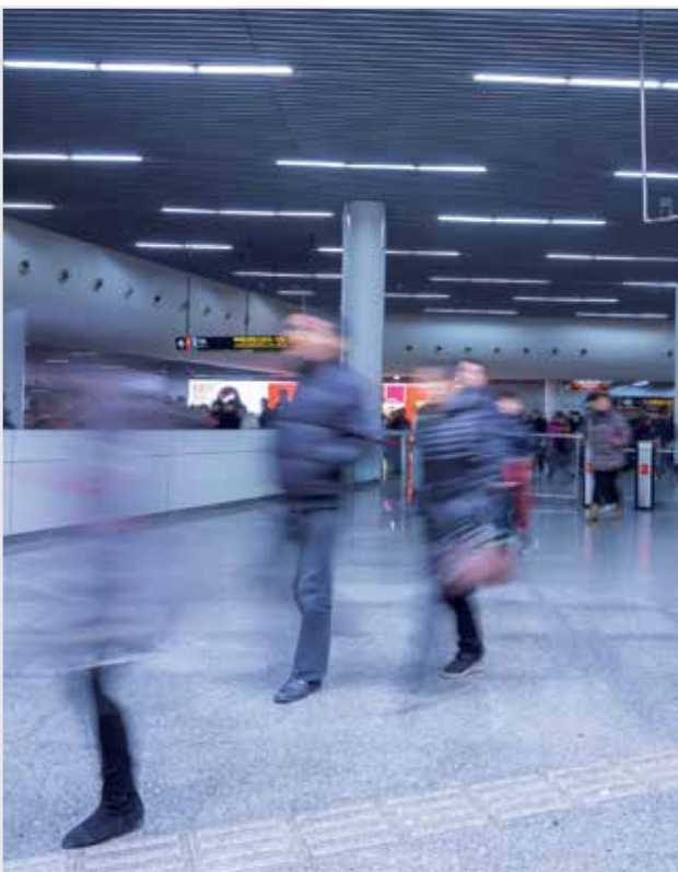
Station de métro à Shanghai (Chine)

Qu'il s'agisse de la conversion d'énergie ou de l'entraînement des machines, Leroy-Somer poursuit sa progression sur le marché international. Cette édition du LS News illustre parfaitement la présence et l'activité de Leroy-Somer à travers le monde. En la parcourant, vous découvrirez de multiples solutions proposées par Leroy-Somer à ses clients sur tous les continents : de l'Asie à l'Afrique et de l'Europe aux Etats-Unis.