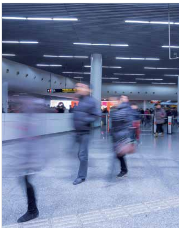
Metrostation in Shanghai (China)

Ob im Bereich Energieumwandlung oder Antriebssysteme, Leroy-Somer ist weiterhin auf den internationalen Märkten im Aufwind. Diese Ausgabe der LS News spiegelt das Engagement und die Aktivitäten von Leroy-Somer auf der ganzen Welt wider. Bei der Lektüre werden Sie die vielfältigen Lösungen entdecken, die Leroy-Somer seinen Kunden auf allen Kontinenten anbietet: von Asien bis Afrika, von Europa bis zu den Vereinigten Staaten von Amerika.