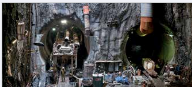
Vue de la construction sous le niveau inférieur actuel de Grand Central Terminal, à New York.

Cette nouvelle liaison augmentera la capacité de transport en direction de Manhattan et réduira considérablement les temps de transport des habitants de Long Island ou du Queens qui, chaque jour, traversent l'East River pour rejoindre la partie Est de Manhattan. Ce projet prévoit une desserte de 24 trains par heure en direction de Grand Central