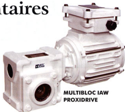
MULTIBLOC IAW PROXIDRIVE

A cette occasion toutes les grandes marques du secteur présentent leurs nouveautés. A l'image de LEROY-SOMER, spécialiste de l'entraînement électromécanique et électronique et de l'alternateur industriel, qui concourra pour les trophées de l'innovation CFIA avec son Motoréducteur MULTIBLOC IAW et qui exposera aussi son nouveau variateur de vitesse pour l'industrie agroalimentaire : PROXIDRIVE.