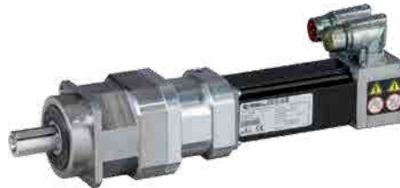
Reductor planetario Pjr

Solución de juego reducido y altas prestaciones