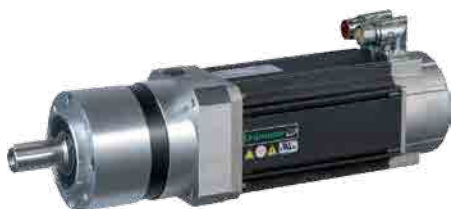
Riduttore planetario Pje Soluzione economica a gioco ridotto