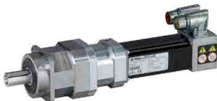
Riduttore planetario Pjr Soluzione a gioco ridotto e alte prestazioni