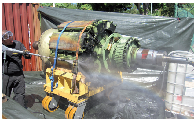
Creación de una estación para limpiar el generador