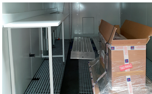
Taller completamente equipado: plataforma elevada, mesa de trabajo, materiales especiales para extracción, ...