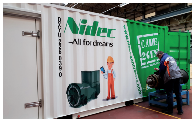
Un taller único que permite realizar todas las etapas de reacondicionamiento de un generador (limpiar, pintar, ...)